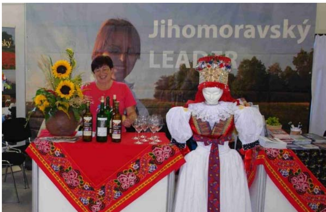
Účast na konferenci Strednodobé hodnotenie Programu rozvoja vidieka SR 2007-2013 a nová politika rozvoja vidieka v EÚ ve dnoch 13.-14.12.2011.