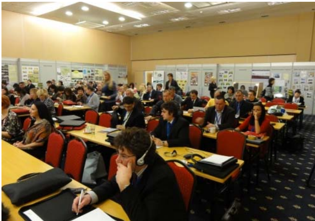
Účast na konferenci Venkov 2011 od 14. do 16. listopadu na Sedlčansku a Sedlecko-Prčicku.